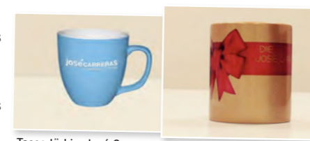
Tasse türkis, José Carreras Leukämie-Stiftung

Machen Sie sich und anderen eine Freude mit den neu aufgelegten José Carreras Tassen. Der Reinerlös jeder Tasse geht an die José Carreras Leukämie-Stiftung und fließt damit direkt in die Projekte.